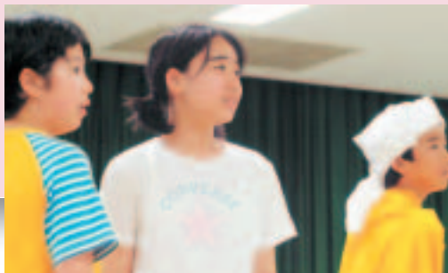
きらりと光る子供たちの熱演