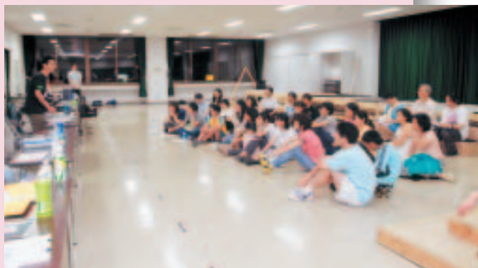
今日一日を振り返る反省会