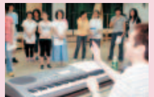
杉江さん(手前)のピアノに合わせみんなで合唱