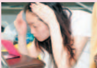
通し稽古に向け準備中